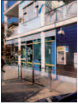
L'ufficio postale di Torbole

TORBOLE SUL GARDA - Nessuna soppressione dell'ufficio postale di Torbole sul Garda ma un semplice spostamento. Poste italiane spa sta cercando in paese locali commerciali di circa 100 metri quadri entro fine anno. Lo stabile attualmente in uso infatti è stato acquistato il 10 dicembre 2007 dalla Cassa rurale di Ledro, banca di credito cooperativo, che così aprirà una filiale nella cittadina benacense. Ad assicurare che non c'è nessuna intenzione di chiudere il servizio è lo stesso direttore delle Poste di Trento, Francesco Multineddu, che ieri ha spiegato: «Abbiamo un contratto di locazione che termina a fine 2008 per cui stiamo cercando di trovare una nuova sede». Di fatto all'esterno degli uffici di via Matteotti è affisso un cartello molto esplicito: «Poste italiane spa cerca in zona centrale a Torbole sul Garda, locali commerciali di 100 metri quadri circa a piano terra da destinare a nuovo ufficio postale».